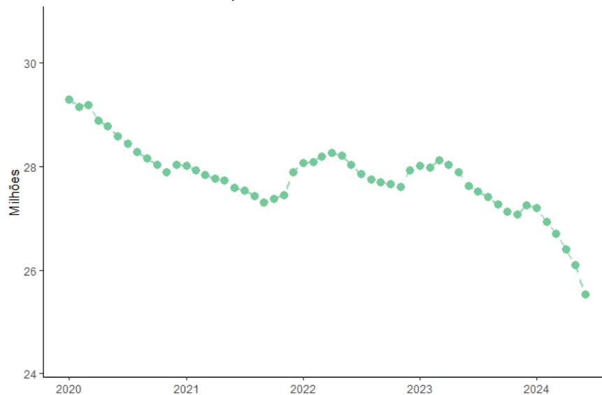
Série histórica dos casos pendentes, Jan-2020 a Jun-2024