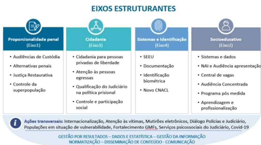
Eixos estruturantes do programa Fazendo Justiça e suas principais iniciativas

Para apoiar o processo de implementação e sustentabilidade das iniciativas do Fazendo Justiça em cada estado, o CNJ, em parceria com o PNUD, disponibiliza uma equipe de profissionais com expertise técnica, trajetória em políticas públicas e atuação nos sistemas de justiça e no socioeducativo.